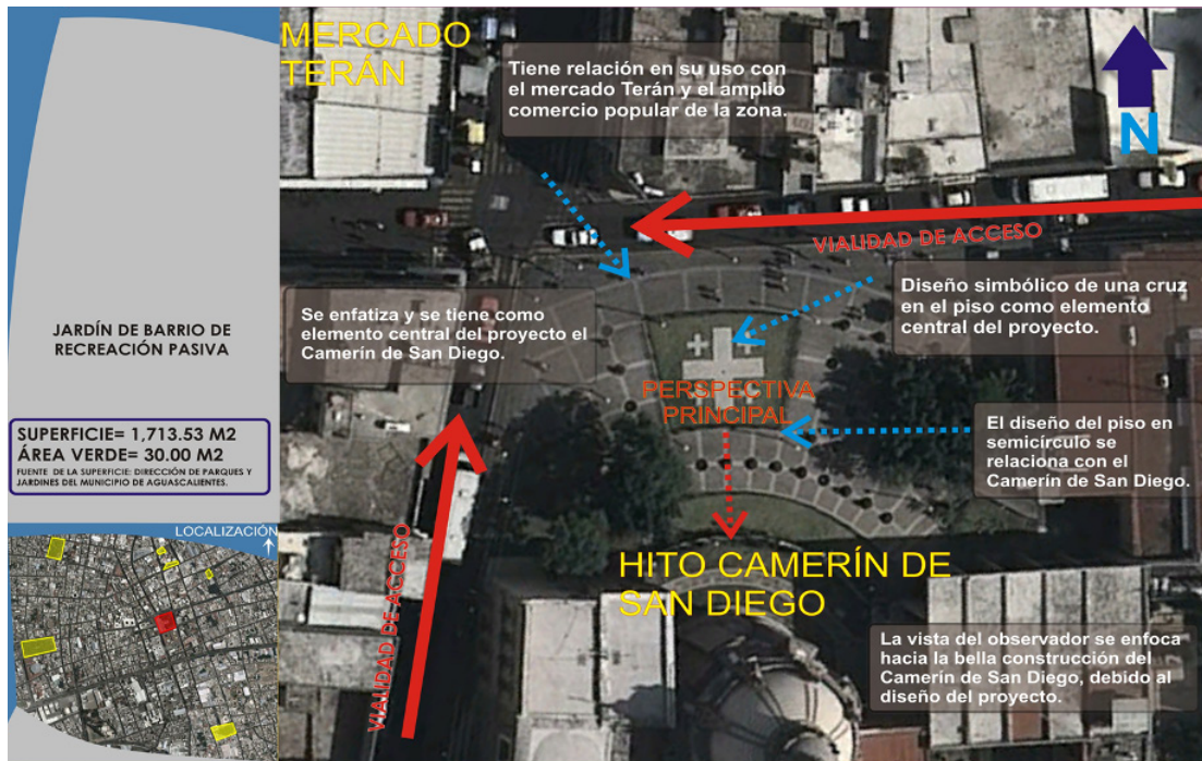
Figura 8. Jardín de San Diego, Características Espaciales.