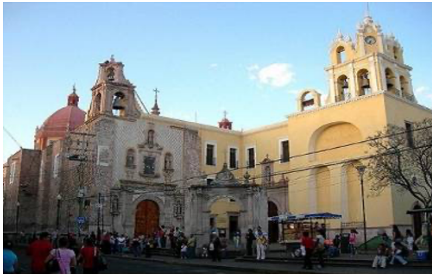
Figura 3. Templo de San Diego.