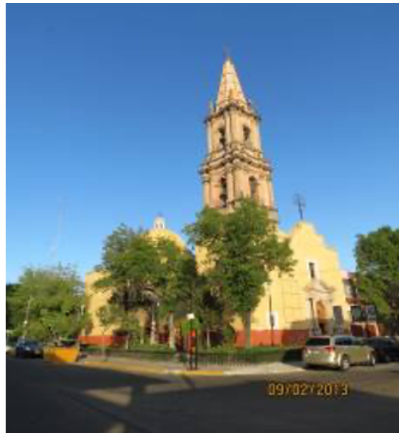
Figura 2. Templo de San José.