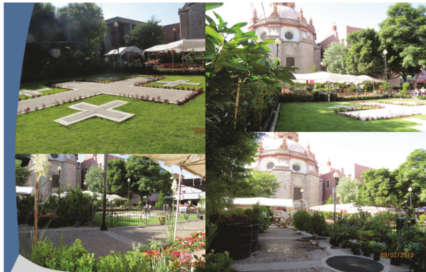
Figura 9. Jardín de San Diego, Imágenes.