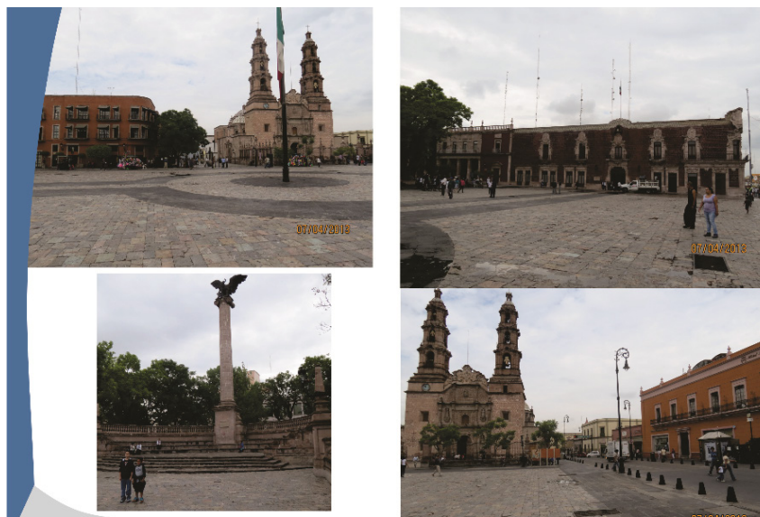
Figura 6. Plaza de la Patria, Imágenes.