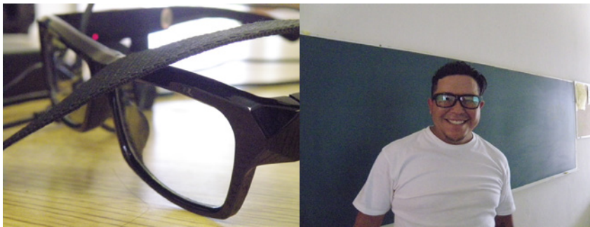
Figuras 3 y 4. Dispositivos utilizados para la recopilación de información a través de video.