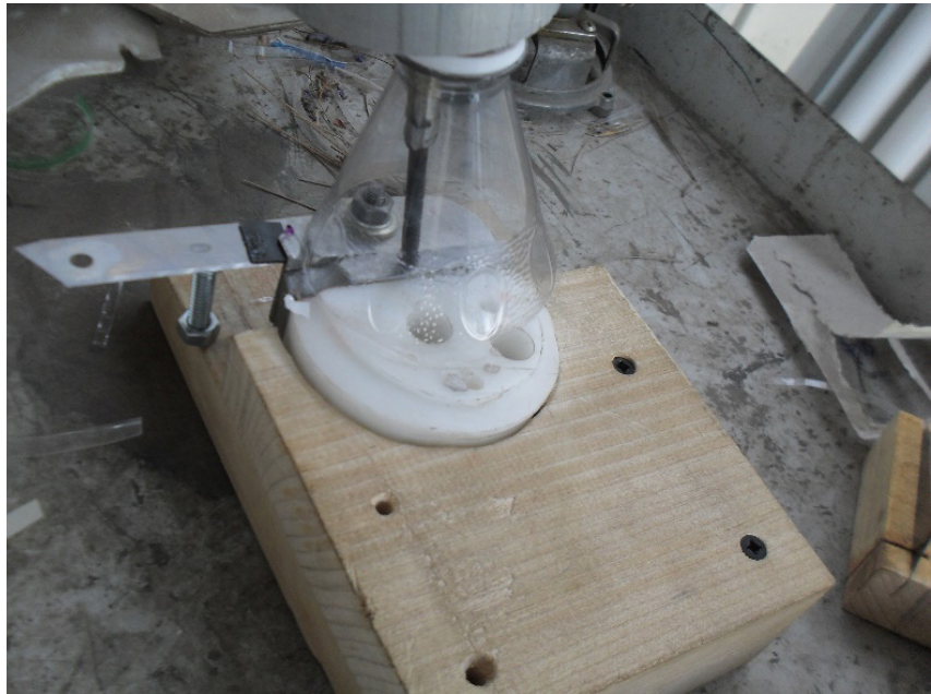
Figura 2. Dispositivo para la extracción de fibras plásticas recicladas, proveniente de botellas.

Por otra parte, es importante denotar que el costo de las fibras poliméricas de venta al público general oscila en 300 pesos el kilogramo. Este aspecto puede ser una oportunidad de desarrollo para la implementación de las fibras recicladas, reduciendo costo y fomentando el desarrollo de la Ingeniería Verde.