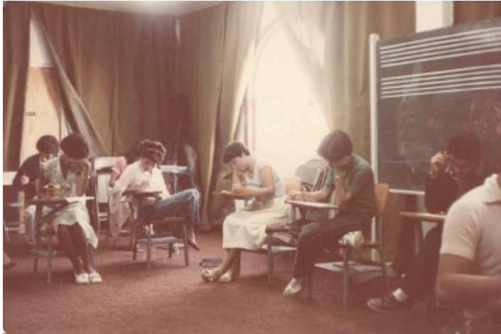
Fotografía 10. Examen de conducción. Edificio Antiguo. (1983).