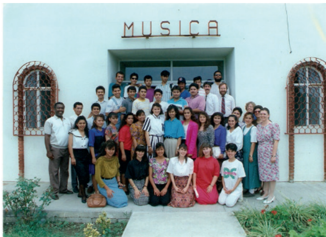
Fotografía 12. Alumnos y maestros. (1993).