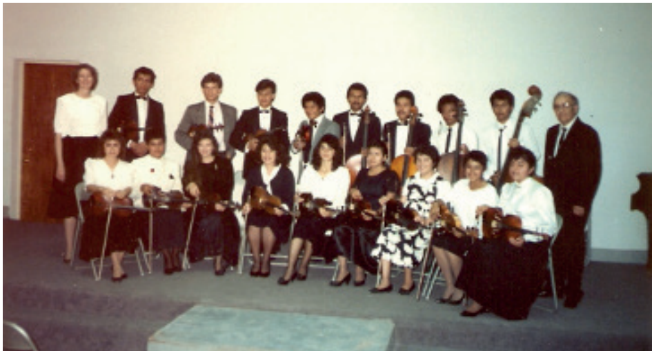
Fotografía 11. Conjunto de Cuerdas. (1990).