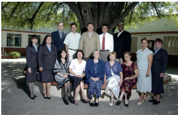
Fotografía 13. Maestros de la Escuela de Música (2007).