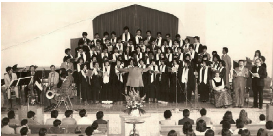
Fotografía 5. Coro Universitario con Ensamble de Metales. (1978).