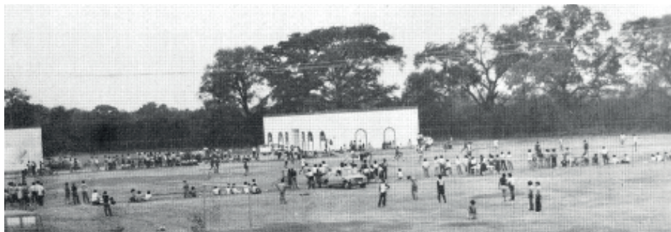
Fotografía 9. Escuela de Música. Edificio antiguo (1980).