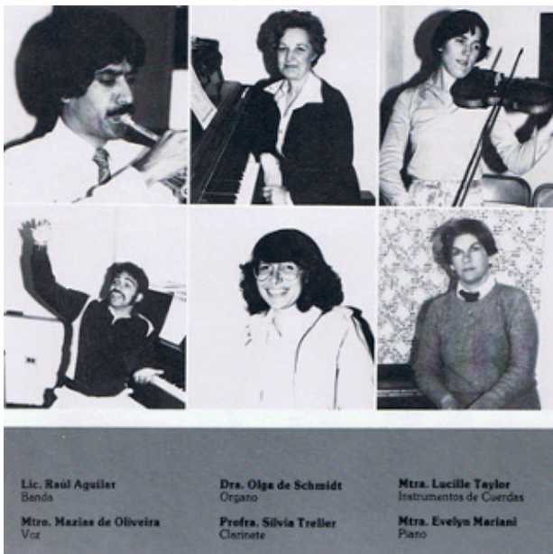
Fotografía 8. Maestros de la Escuela de Música. (1981-1982).

Recuperado de Museo de la Universidad de Montemorelos.