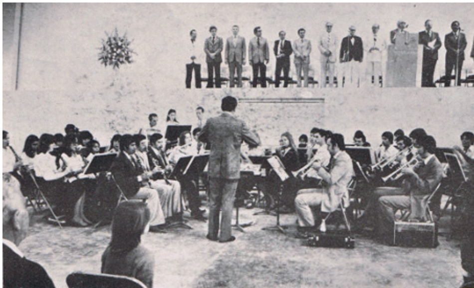
Fotografía 3. Banda Universitaria. (1978).