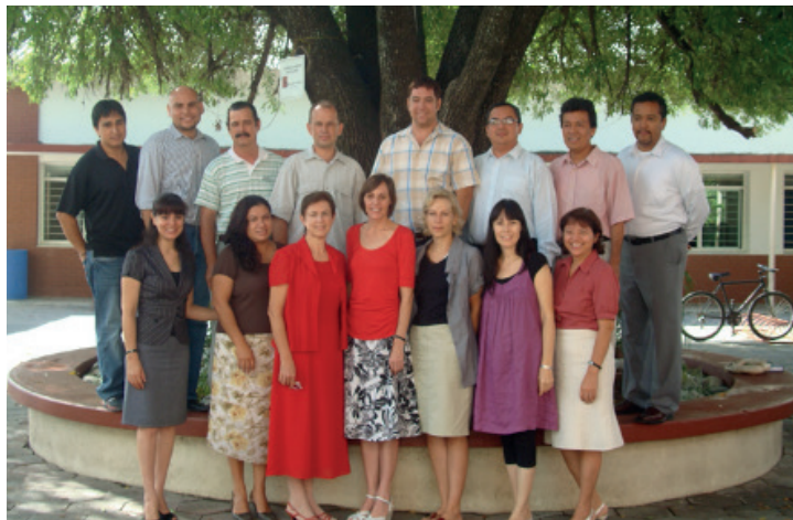
Fotografía 14. Maestros de la Escuela de Música (2011).