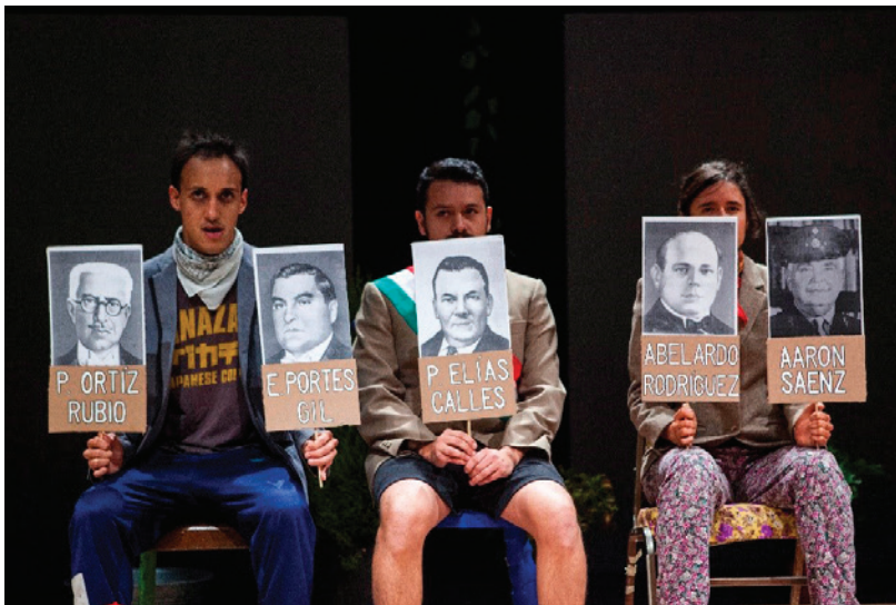
Imagen 3. Derretiré con un cerillo la nieve, LTS 1