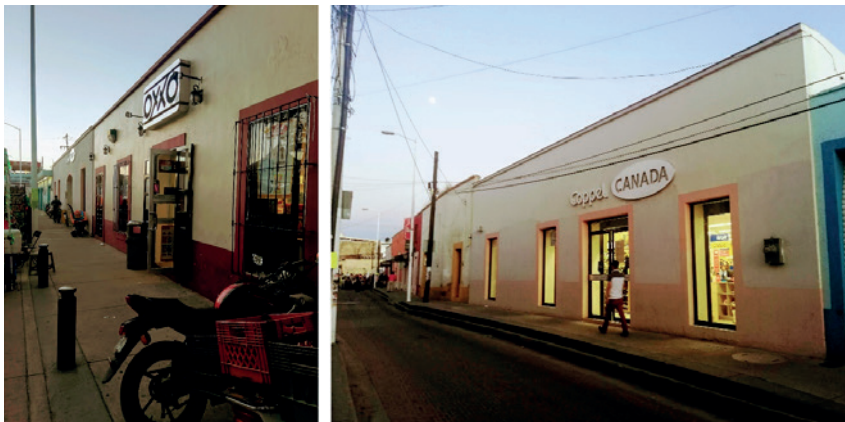
Figura 5. Nuevos servicios comerciales en la plaza de Tesistán.