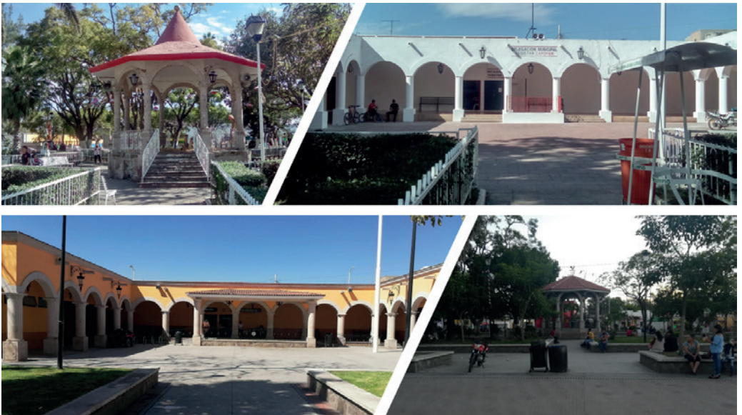
Figura 3. Remodelación de la plaza y delegación del pueblo.

de regeneración urbana y (re)urbanización en zonas con interés altamente capitalista. En nuestras ciudades este fenómeno también puede aparecer como una política de crecimiento urbano favoreciendo la “residencialización”, como una forma que privilegia el fraccionamiento popular, el fraccionamiento cerrado y otras formas que ofrece el capital inmobiliario.