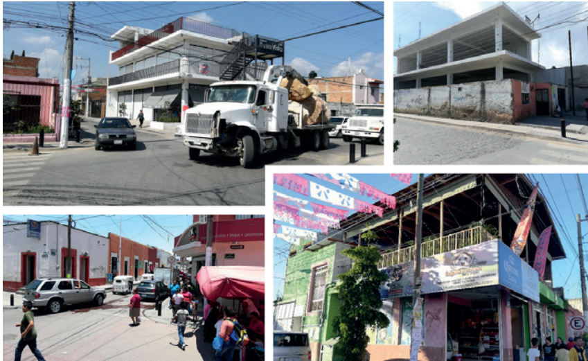
Figura 4. Rápida transformación del espacio construido en las principales vías del pueblo.