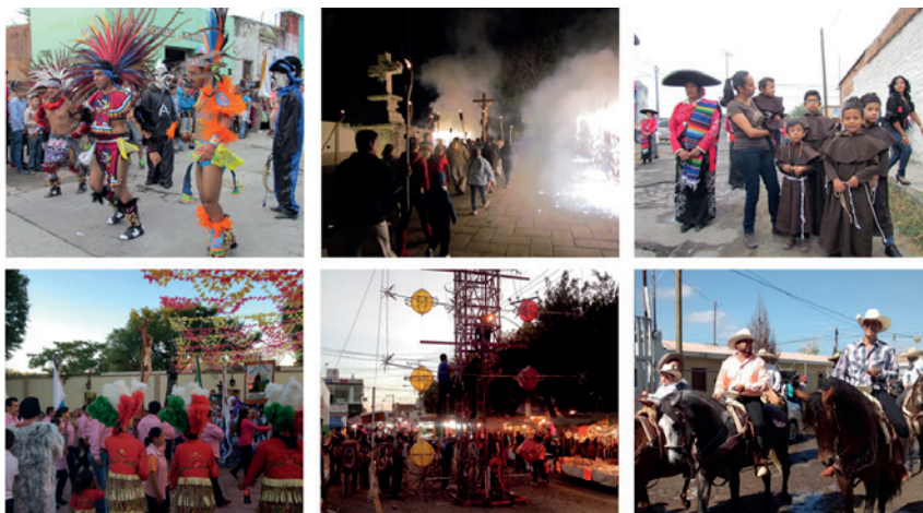
Figura 6. Estampas de la fiesta patronal a San Francisco Tesistán.

bano y la transformación de la mancha urbana de la metrópolis y la local. Uno de los efectos ocasionados por el crecimiento urbano y la llegada de una población que compra su casa en Tesistán es el convertir la fiesta en un espectáculo, como una estrategia de conservación identitaria de los pobladores; además, como una respuesta en defensa y mantenimiento de la identidad de los tesistenses.