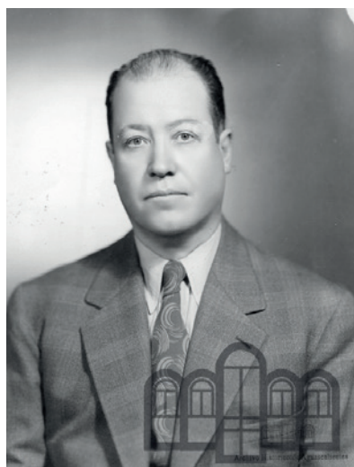
Imagen 3. Dr. Alberto del Valle, gobernador de Aguascalientes.