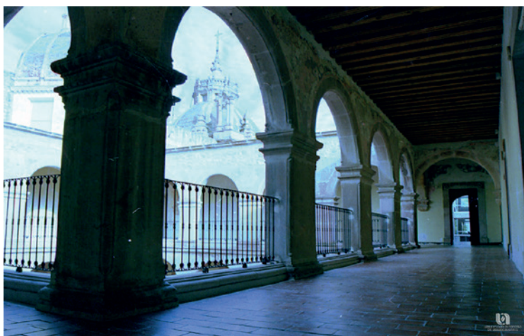
Imagen 1. Instituto de Ciencias en Aguascalientes.

ras de gobierno en la vida interna de las universidades públicas; desde otra óptica, no del todo ajena a la anterior, tiene que ver con la participación de los estudiantes y profesores en la definición del gobierno interno y de las normas que rigen la vida universitaria, lo que rescata la idea medieval de la corporación de estudiantes y profesores para el desarrollo libre y autónomo de las funciones académicas. En ese sentido, la autonomía universitaria en América Latina retoma muchos componentes del ideal medieval que dio origen a las universidades, pero imprimiéndoles un elemento político de alcances mucho más significativos: la no intervención gubernamental (ni de otra índole) en la definición del régimen jurídico interno, y mucho menos en el diseño de los planes de estudio y los criterios de evaluación para la obtención de títulos y grados.