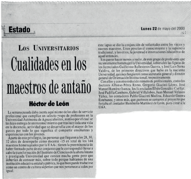
Imagen 1. Nota titulada “Cualidades en los maestros de antaño”.