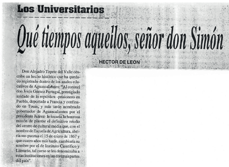
Imagen 4. Nota titulada "Qué tiempos aquellos, señor Don Simón".