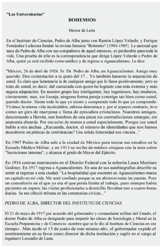
Imagen 6. Nota titulada "Bohemios".