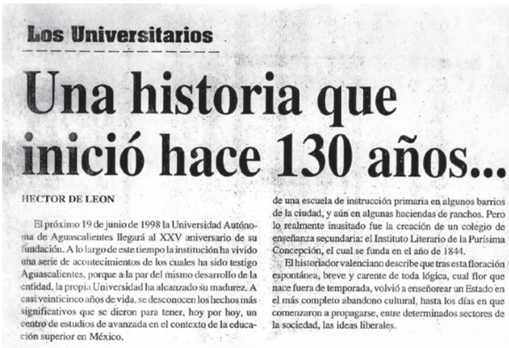
Imagen 2. Nota titulada “Una historia que inició hace 130 años”.