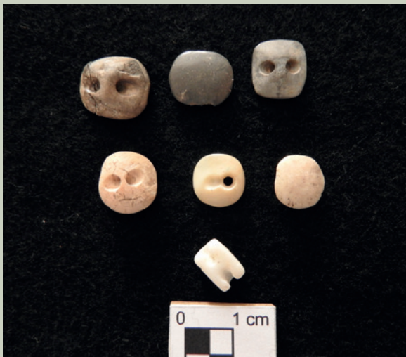
Imagen 21. Botones de diversas formas encontrados en El Ocote, elaborados sobre diferentes rocas (J. Jiménez)