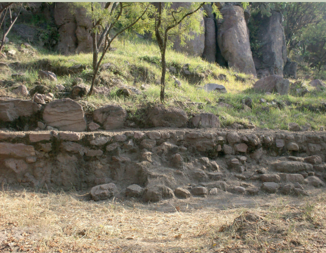
Imagen 3. Muro donde se aprecia la superposición de hiladas de ignimbrita; se pudo identificar un fragmento de enjarre sobre la cara externa, como acabado superficial (J. Jiménez)