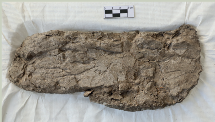
Imagen 4. Detalle del enjarre del muro; de acuerdo al análisis realizado, se identificó una mezcla fina de arcilla, arena y agua, aplicada sobre la superficie que posteriormente fue alisada (G. Sifuentes)