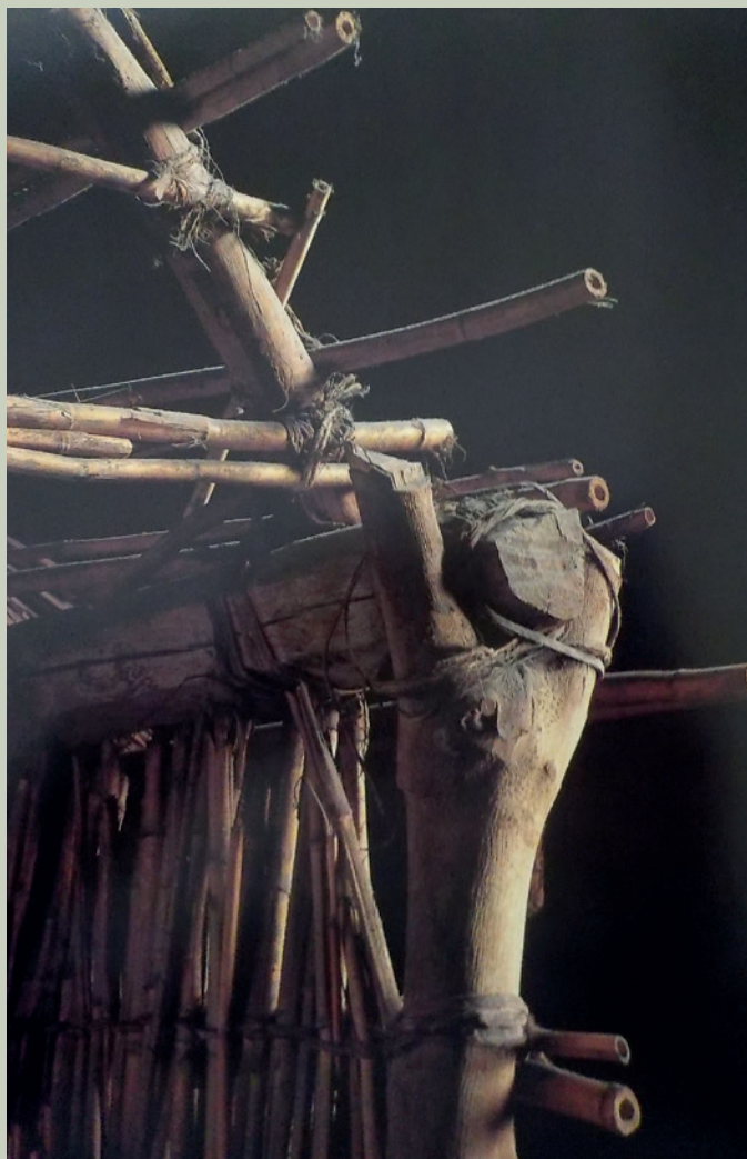
Imagen 11. Armazón construida para sostener la techumbre. En las esquinas del cuarto se colocan horcones en los que se apoya la estructura que dará forma a los techos que a su vez soportarán la cubierta vegetal: palma, ramas, zacate, pencas (Modificada de Matos y Guzmán, 1999)