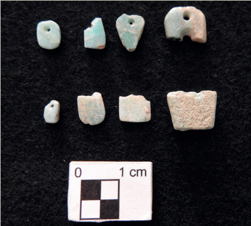
Imagen 19. Pendientes de piedra color verde azulado, muy apreciadas en la antigüedad. Se analizan para conocer si se trata de amazonita, malaquita o serpentina (J. Jiménez)