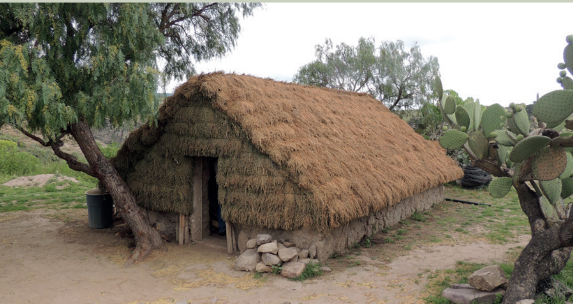
Imagen 10. En comunidades rurales actuales todavía se encuentran construcciones de materiales perecederos, en este caso particular, cimientos y muros de piedra y techo a dos aguas cubierto con ramas de engordacabra en El Cópore, Guanajuato (J. Jiménez)