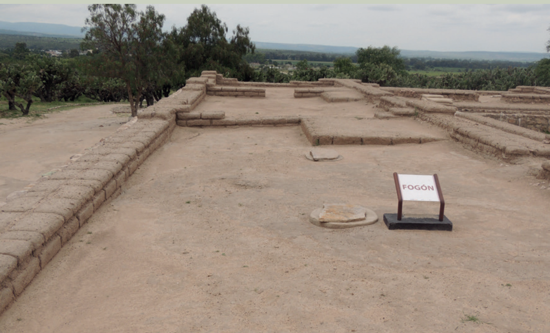
Imagen 6. El Cópore, Guanajuato. Al lado izquierdo se aprecian los adobes empleados para construir el muro y, al centro de la imagen, la ubicación de un fogón (J. Jiménez)