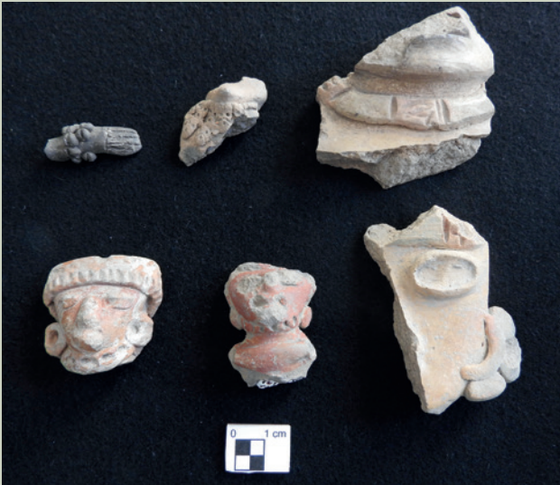
Imagen 20. Fragmentos de figurillas de barro que evidencian diferentes tipos de ornamentos. Fila superior: brazo con pulsera de conchas y otras dos versiones de collares. Fila inferior: variedad de orejeras y collares (J. Jiménez)