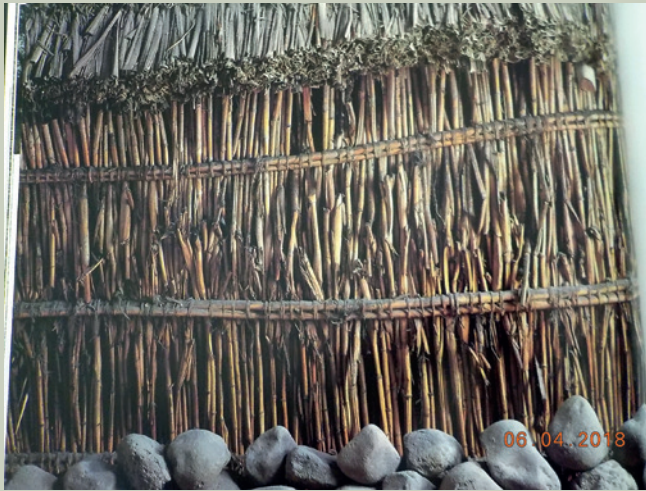
Imagen 7. En la gráfica se aprecian detalles de cimentación, paredes de material vegetal y un fragmento de techo, sistema constructivo actual en algunas zonas rurales