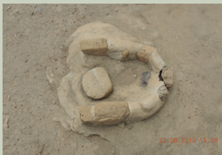
Imagen 15. En El Ocote se encontraron dos tipos de fogones: cuadrangulares y ovalados; ambas formas son frecuentes en otros sitios arqueológicos de la región (J. Jiménez)