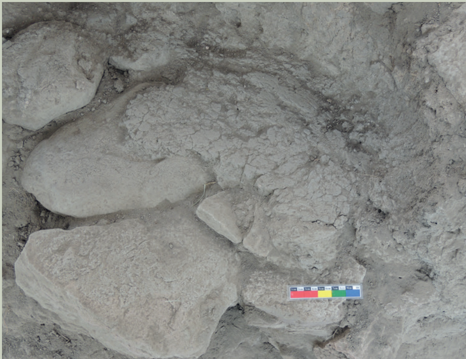
Imagen 14. Restos de posible silo o granero encontrado en El Ocote