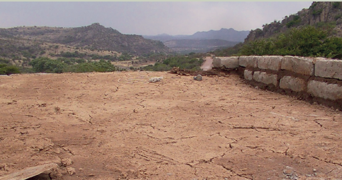
Imagen 13. La última capa del techo de terrado está conformada por tierra compacta que impedirá filtraciones (J. Jiménez)