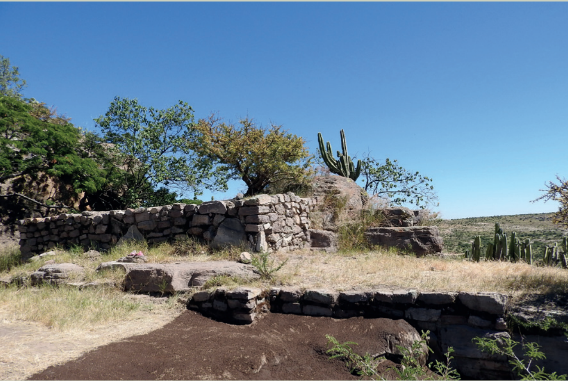
Imagen 1. Estructura ubicada en la cima del cerro, orientada hacia el poniente, construida con la roca local empleando el sistema de muros dobles (J. Jiménez)