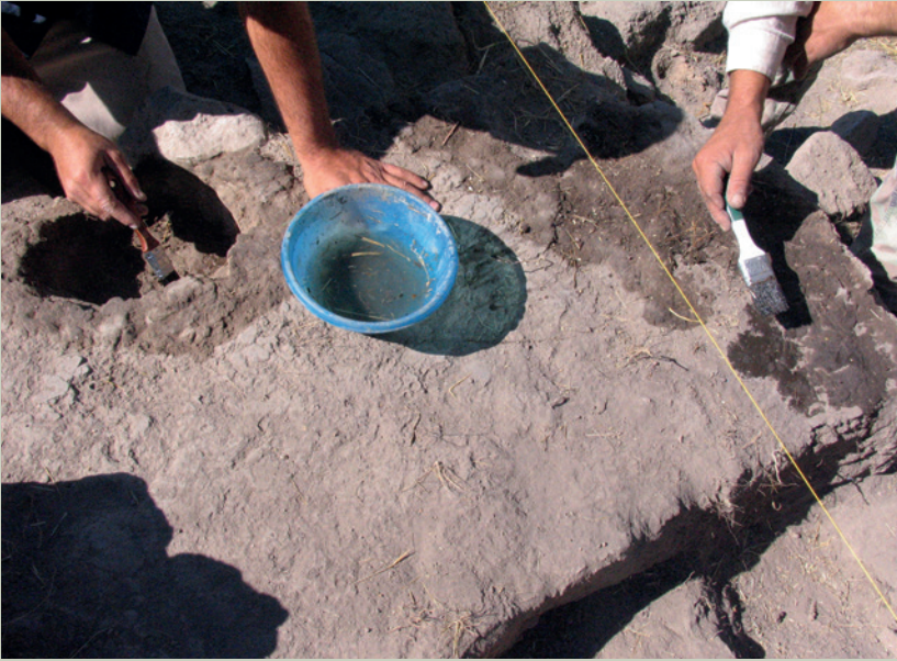
Imagen 9. Proceso de consolidación con baba de nopal, de un piso encontrado en el sitio arqueológico El Ocote (J. Jiménez)