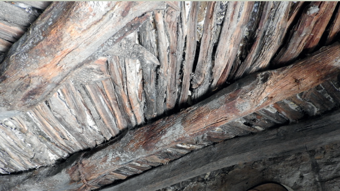
Imagen 12. Para los techos de terrado, se coloca sobre las vigas una capa de tabletas de mezquite que se cubrirá después con tierra (J. Jiménez)