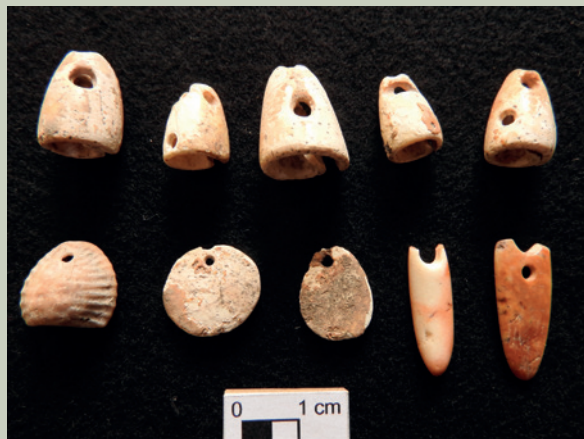
Imagen 17. Piezas ornamentales trabajadas sobre conchas encontradas junto a los entierros infantiles y juveniles (J. Jiménez)