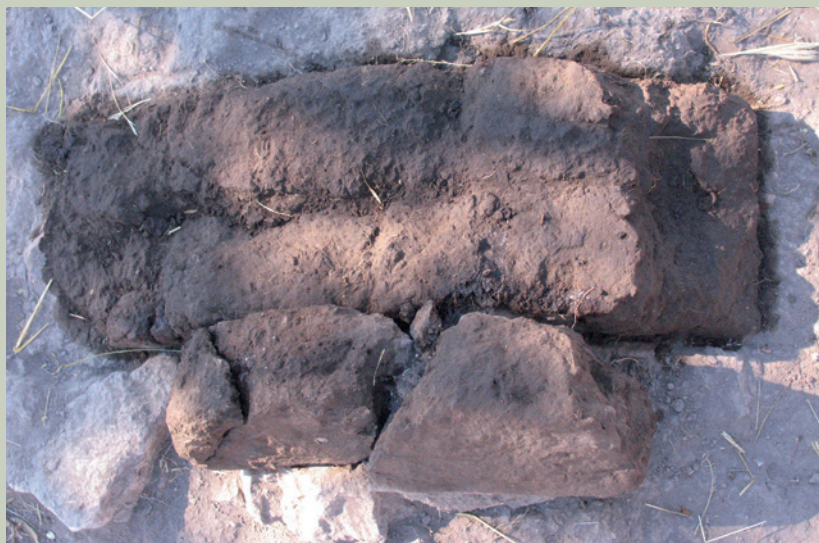
Imagen 5. Adobe recuperado durante las exploraciones en El Ocote. Todavía en la actualidad se hacen construcciones con este material (J. Jiménez)