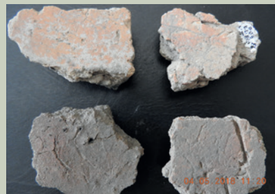
Imagen 8. Ejemplos de bajareque encontrados en El Ocote. En la parte superior se puede apreciar la huella del quíote de sotol; en la inferior detalles del grosor, acabado y coloración de algunos ejemplares (J. Jiménez)