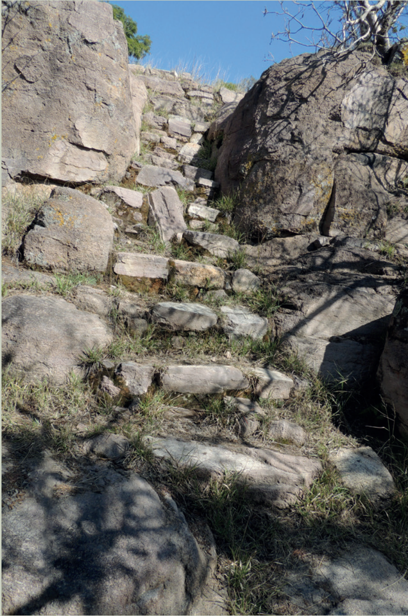
Imagen 2. Escalera que comunica dos diferentes terrazas que se localizan en la ladera sur del cerro (J. Jiménez)