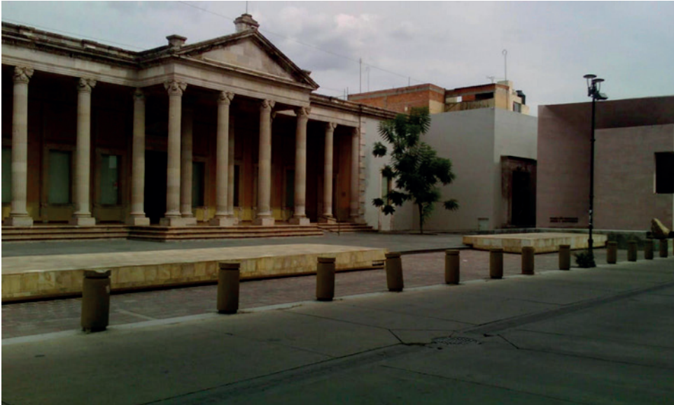
Figura 2. Imagen urbana de la plaza de acceso del museo de Aguascalientes.

En cuanto a la imagen urbana de las ciudades, los espacios públicos la enriquecen por medio de sus espacios abiertos y al aire libre ya que permiten una visualización más clara del contexto donde están inmersos, además, por sus características, permiten mejorar la imagen urbana con la integración en sus espacios de áreas verdes, de vegetación, de elementos escultóricos, de fuentes, de espejos de agua, de velarias, de pergolados, de techumbres, entre otros elementos de diseño urbano.