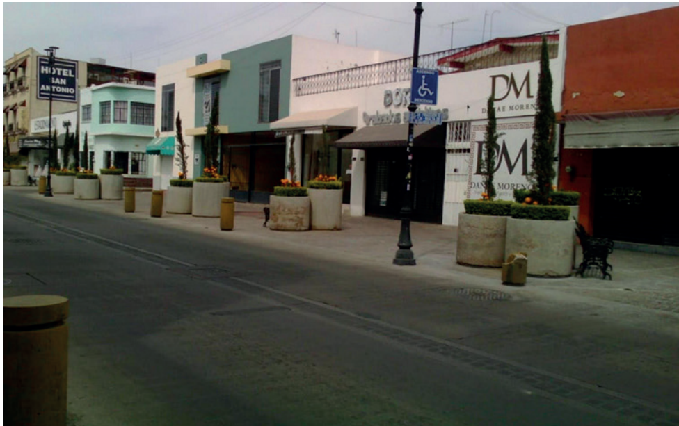
Figura 3. Vista de la calle Gral. Ignacio Zaragoza.

de los efectos de contaminación que esta misma ocasiona. Los espacios públicos generan en la estructura urbana de las ciudades un equilibrio entre los diversos lugares que la conforman, por medio de sus zonas abiertas y áreas verdes, además, sitios públicos como andadores, plazas, jardines, calles, entre otros, funcionan como elementos de vinculación entre los espacios que integran esta estructura.