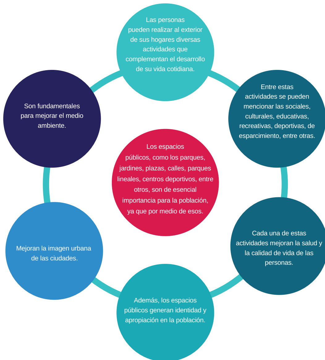
Figura 1. Esquema de la importancia de los espacios públicos.

y para las personas que habitan en ellas. Los espacios públicos –parques, parques lineales, centros deportivos, jardines, plazas, calles– son necesarios para estructurar adecuadamente los espacios que conforman las ciudades, y así, en esta estructuración, exista un equilibrio en la imagen urbana, la aportación de beneficios al medio ambiente, la funcionalidad y las actividades que se generan en este tejido urbano.