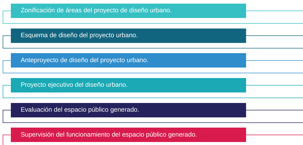
Figura 6. Esquema de las etapas del proceso de proyección, construcción y función de un espacio público determinadas en este proyecto de investigación con base en la revisión de proyectos de diseño urbano elaborados, y por medio de la consulta de propuestas metodológicas generadas por diversos autores.