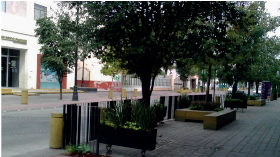
Figura 4. Vistas de la calle Francisco I. Madero.