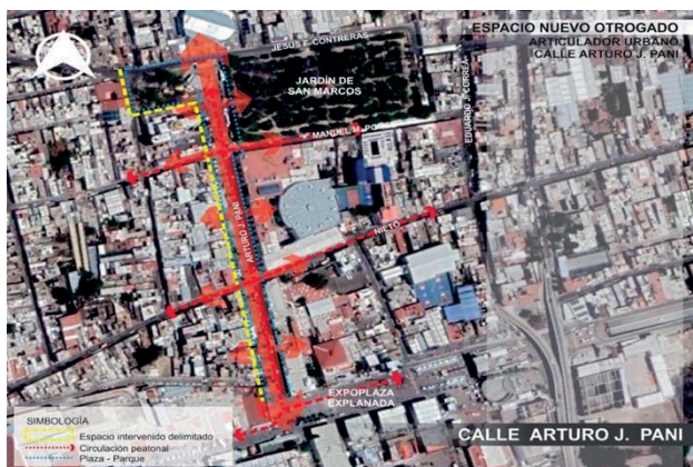
Figura 5. Descripción de espacio público intervenido, calle Arturo J. Pani.

En la figura 5 se muestra la intervención de regeneración urbana implementada en la calle Arturo J. Pani, la cual peatonaliza el espacio integral de la calle en tres tramos. Derivado de ello, se obtuvo una zona de andador de conexión entre el jardín del barrio de San Marcos con la zona de la Expo Plaza, mismo que es utilizado en la Feria Nacional de San Marcos. Tras la intervención, este espacio público urbano cuenta con cruces a nivel para los peatones, haciéndolo un lugar exclusivo y seguro para caminar.