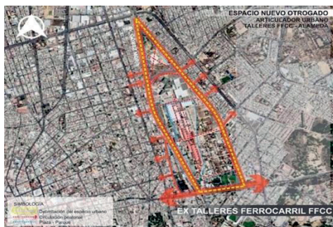
Figura 4. Gráfico de descripción de espacio público intervenido extalleres FFCC.

En la figura 4 se muestra la estrategia aplicada en el nuevo complejo de los extalleres centrales del ferrocarril en Aguascalientes, espacio regenerado en el que se eliminó un gran borde urbano de tres mil metros de largo que impedía la integración del centro de la ciudad y sus ciudadanos con el oriente. Ahora, el espacio intervenido representa el nodo principal de encuentro y activación comunitaria.