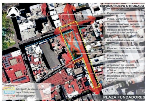
Figura 8. Descripción de espacio público intervenido: calle Dr. Díaz de León.

La intervención de regeneración urbana se puede observar en la siguiente imagen (figura 8), en donde se rescató un espacio público abandonado y se convirtió en uno de múltiples actividades para los ciudadanos.