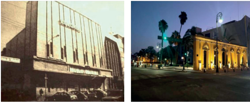
Fotografías 8 y 9. Espacio regenerado en la calle Dr. Díaz de León.

La intervención de regeneración urbana se puede observar en la siguiente imagen (figura 8), en donde se rescató un espacio público abandonado y se convirtió en uno de múltiples actividades para los ciudadanos.