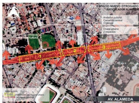
Figura 6. Descripción del espacio público intervenido de la Av. Alameda.

En la imagen siguiente (figura 6) se muestra la intervención de regeneración urbana aplicada, en donde se rescató un espacio público central de la avenida, con el objetivo de reconstruir el tejido social de la comunidad y fomentar la integración funcional de este espacio con las colonias aledañas. Se intervinieron tres tramos para su utilización mañana, tarde y noche, los siete días de la semana.