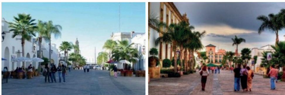
Fotografías 2 y 3. Espacio regenerado: andador Arturo J. Pani, ahora y antes.

En la figura 5 se muestra la intervención de regeneración urbana implementada en la calle Arturo J. Pani, la cual peatonaliza el espacio integral de la calle en tres tramos. Derivado de ello, se obtuvo una zona de andador de conexión entre el jardín del barrio de San Marcos con la zona de la Expo Plaza, mismo que es utilizado en la Feria Nacional de San Marcos. Tras la intervención, este espacio público urbano cuenta con cruces a nivel para los peatones, haciéndolo un lugar exclusivo y seguro para caminar.