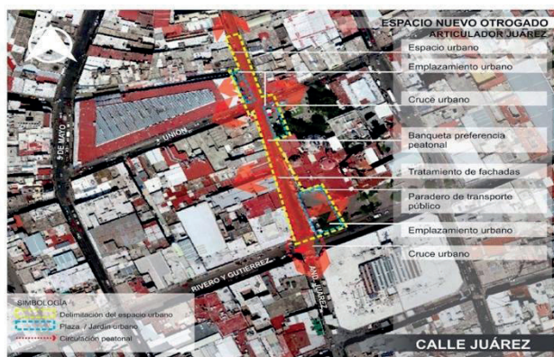
Figura 7. Descripción de espacio público intervenido: calle Lic. Benito Juárez.

En la imagen de la calle Lic. Benito Juárez (figura 7) se describe la intervención de regeneración urbana de varios espacios públicos. Se rescataron las 17 fachadas de antiguas e históricas construcciones, de gran valor simbólico, de la ciudad. Se retiraron 21 puestos de ambulante de las aceras y estas se ampliaron, mejorando la accesibilidad universal, así como la introducción de huella podotáctil para guía de personas débiles visuales. Se introdujo alumbrado público ornamental y se generaron cruces seguros.