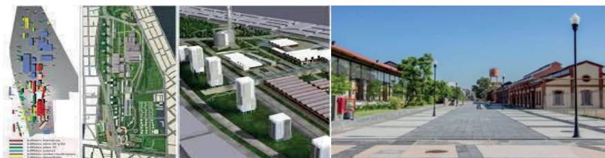
Figura 3 y Fotografía 1. Espacio regenerado de los extalleres de FFCC.

En la figura 4 se muestra la estrategia aplicada en el nuevo complejo de los extalleres centrales del ferrocarril en Aguascalientes, espacio regenerado en el que se eliminó un gran borde urbano de tres mil metros de largo que impedía la integración del centro de la ciudad y sus ciudadanos con el oriente. Ahora, el espacio intervenido representa el nodo principal de encuentro y activación comunitaria.