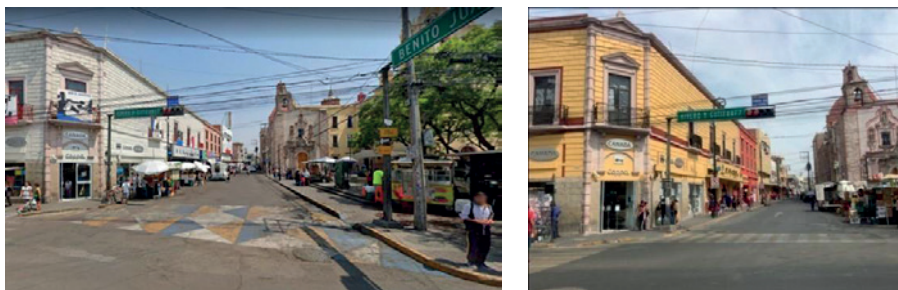
Fotografías 6 y 7. Espacio regenerado: calle Lic. Benito Juárez.

Se cambió la imagen urbana de las edificaciones y mobiliario e iluminación clásica del centro histórico; se conformó un paseo andador de integración de las zonas principales de abasto y comercio de la ciudad, reforzando el turismo de visitantes por la atracción y seguridad del espacio.