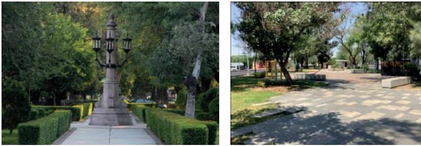
Fotografías 4 y 5. Espacio regenerado: Av. Alameda, antes y ahora.

En la imagen siguiente (figura 6) se muestra la intervención de regeneración urbana aplicada, en donde se rescató un espacio público central de la avenida, con el objetivo de reconstruir el tejido social de la comunidad y fomentar la integración funcional de este espacio con las colonias aledañas. Se intervinieron tres tramos para su utilización mañana, tarde y noche, los siete días de la semana.