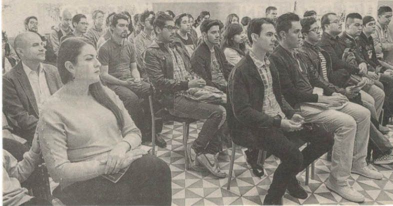
Ilustración 1. Nota publicada en El Herald el jueves 16 de agosto de 2018.

Para mayor información, cualquier interesado puede consultar la información en la página de la UAA o acudiendo directamente al departamento de Música de la Autónoma de Aguascalientes, el cual está ubicado en la calle Álvaro Obregón número 419, en la zona Centro de la ciudad. O comunicándose al teléfono 916-43-61 de 8:00 a 15:30 horas.