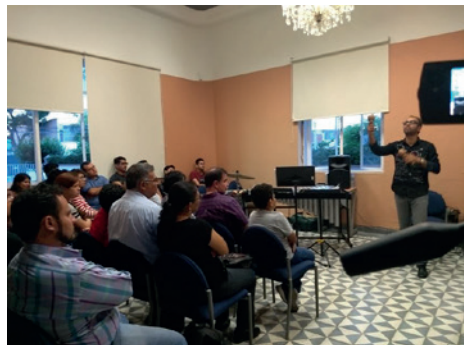
Ilustración 2. Semana de la Música 2018.

En este año 2020, la modalidad fue diferente debido a la contingencia sanitaria que se vive producto del virus SARS-CoV-2, ya que normalmente dicho evento se realiza en las instalaciones universitarias, pero en esta ocasión tuvo lugar en internet y no fue en el mes de agosto, sino en octubre, debido a la esperanza de que la crisis sanitaria pasara y tanto alumnos y profesores como público en general