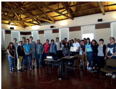
Ilustración 3. Semana de la Música 2019.

La virtualidad juega como un arma de doble filo. Por un lado, la congregación en un no-lugar limita la interacción física y directa con los ponentes, concertistas y asistentes; la experiencia del en vivo se transforma y la manera de hacer la música está sujeta a ambientes controlados y a la posibilidad de hacerlo una y otra vez para